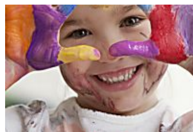
Faire une... Elle.fr